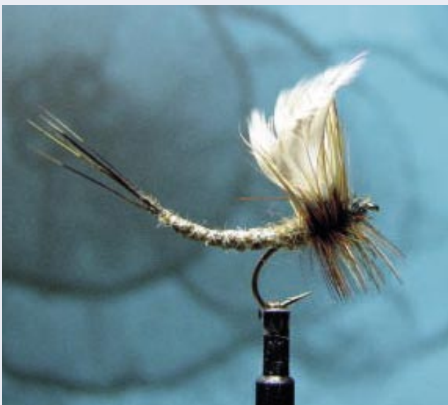
Die Fliegen sind kleine Kunstwerke.